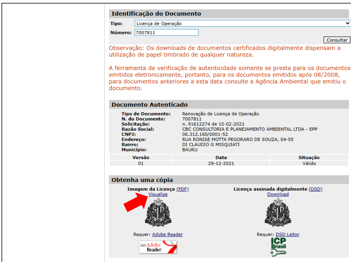
Figura 9. Documento autenticado e link “Visualize”.